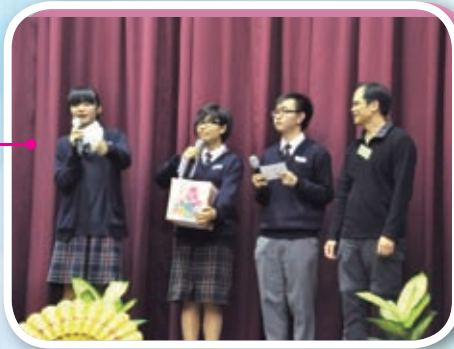
美妙的夜晚，我們與父母、老師、同學、兄弟姊妹一起品嚐熱騰騰的圍村盆菜。