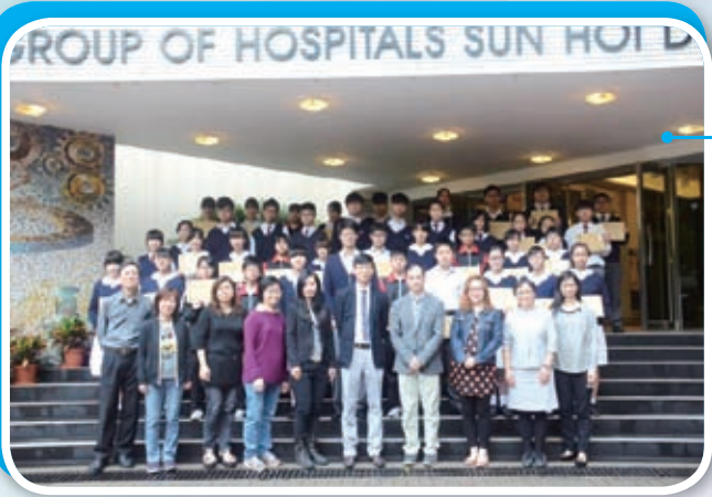
家長、老師和所有學業進步獎得主拍照，願大家百尺竿頭，更進一步！