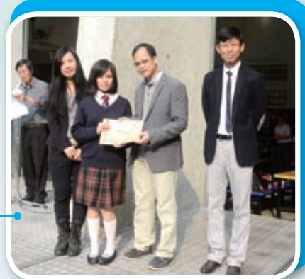
家長代表頒發學業進步獎給本學期學業猛進的同學。包容與鼓勵，尊重與關愛，難以擺脫羞澀靦腆的學子，將勇敢走向一個更大的舞台。