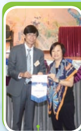
我們請來了護士，主持笑瑜伽工作坊，講解這運動背後的理念。