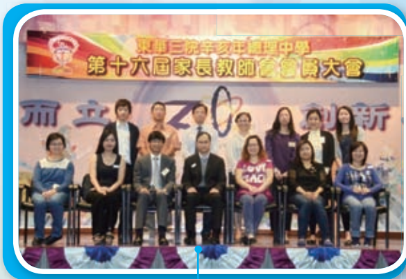
每年的家長教師會都增添了新面孔，感謝家長、老師對學校辦學的支持。