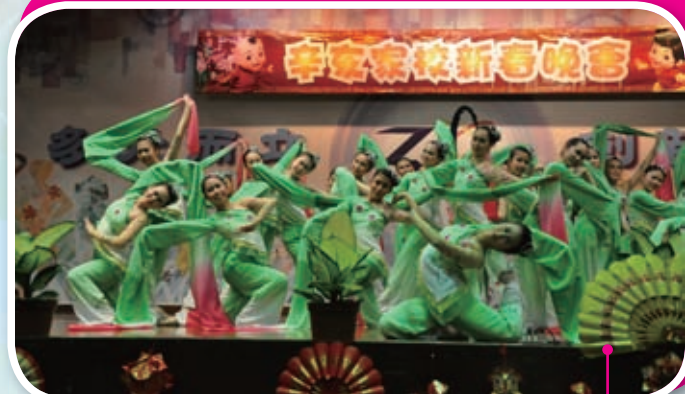
熱鬧的音樂，色彩繽紛的畫面，這是我們屢創佳績的舞蹈表演。