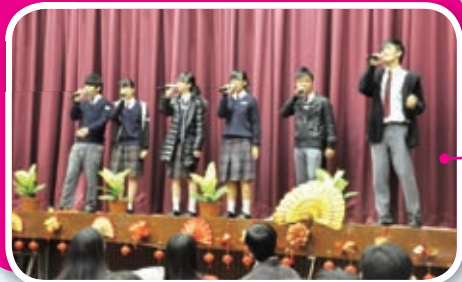
小組合唱真精采，英文歌、中文歌，難不倒辛亥學子。