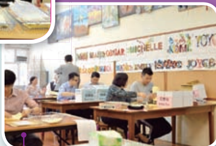
點票時間到了，先由老師分成小組，倒出箱中所有選票，認真點票。