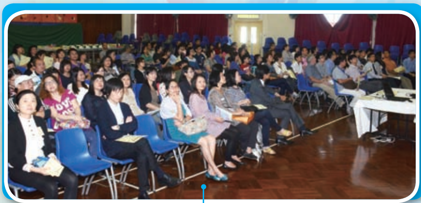
禮堂坐滿了家長，這是一年一度，盛大的第十六屆家長教師會會員大會。