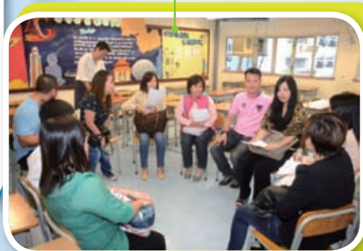
會後，我們移師教室，先聽聽班主任的意見，再回家與小朋友溝通。