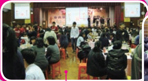
宴開35席，場面盛大的辛亥新春盆菜宴。