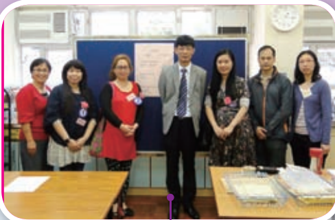
2014年3月31日為家長校董選舉日，這屆的家長校董任期將由2014年9月10日至2016年9月9日。