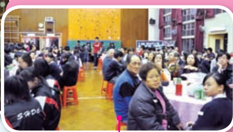
是夜燈火通明，人聲鼎沸，我們與親愛的父母、兄弟姊妹、老師、同學一起慶祝馬年的來到。