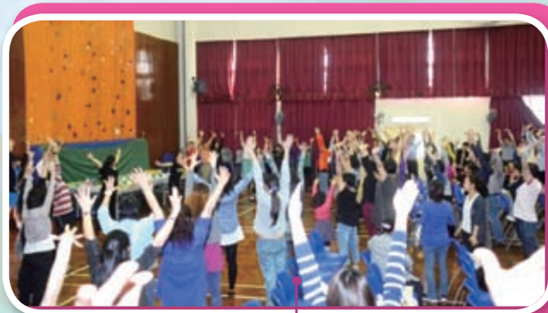
互動時間到了，大家聽過理論後，付諸實踐吧！笑著做瑜伽。