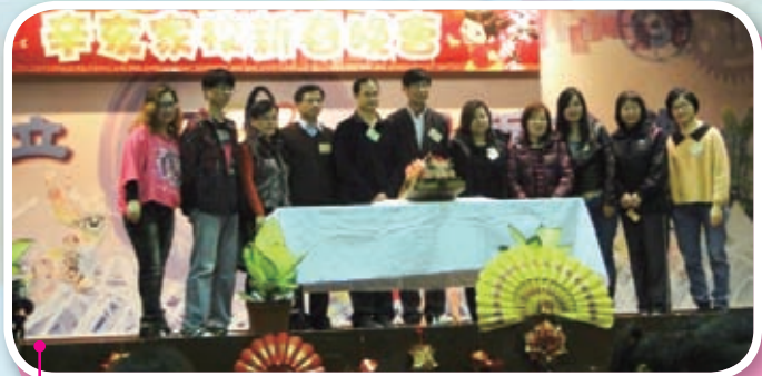
家長執委與校長們宣佈新春晚宴開始，長輩們為同學們獻上了新春的祝賀。校長贊助金豬，寓意大家全年順境。